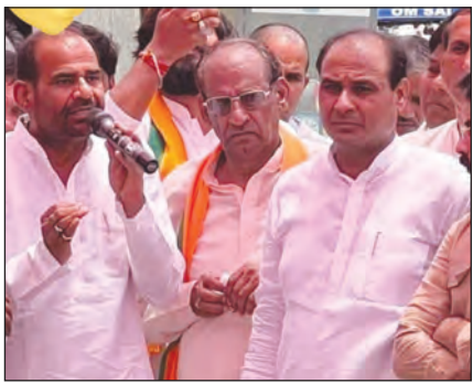
दिल्ली में भीषण जल संकट को लेकर बीजेपी नेता रमेश बिधुड़ी विरोध प्रदर्शन करते हुए।